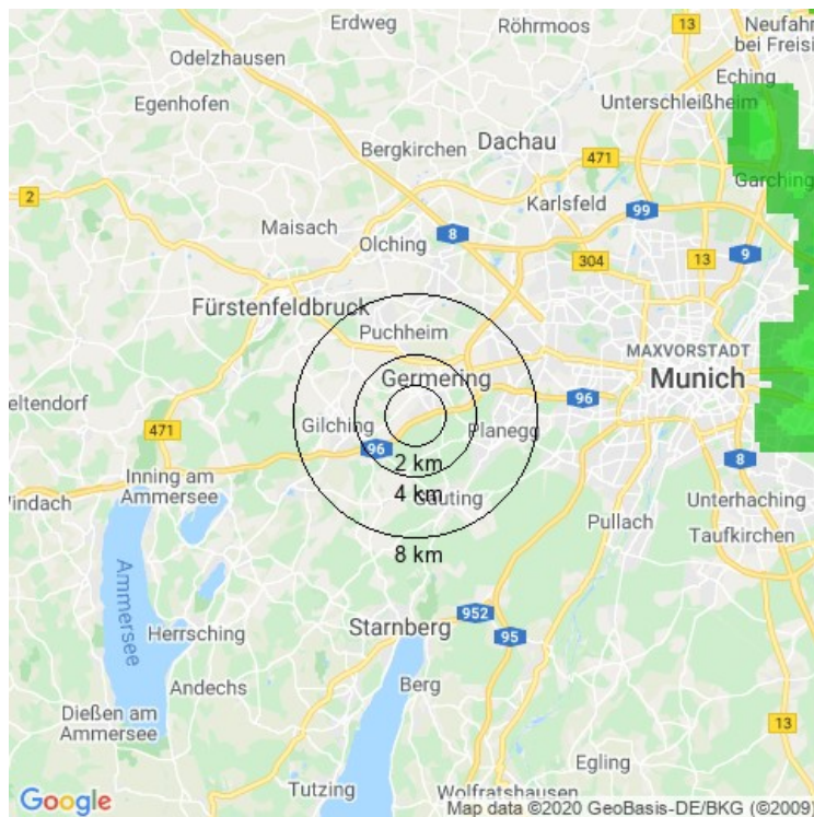
Abbildung: Aufgetretene maximale Hagelkorngröße in einem Umkreis von 8 km.